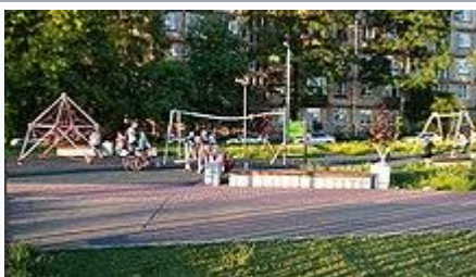
Новая детская площадка в реконструированном Ивановском саду