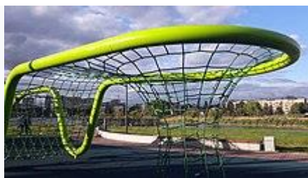
Детская площадка на Ивановском карьере

Местными жителями карьер используется как зона отдыха. Здесь люди ловят рыбу, загорают, устраивают пикники, а также просто прогуливаются. Однако берега были очень засорены мусором, а вода у берегов была заболочена