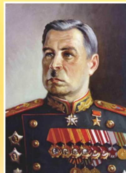
Маршал Советского Союза ГОВОРОВ Леонид Александрович (1897–1955)