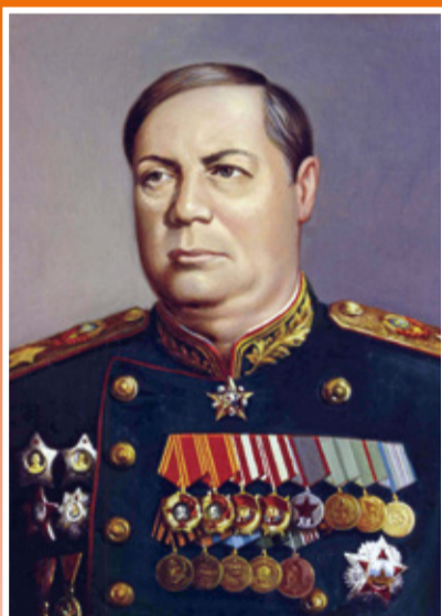
Маршал Советского Союза ТОЛБУХИН