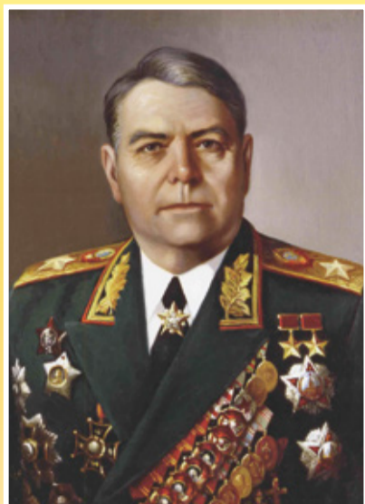
Маршал Советского Союза ВАСИЛЕВСКИЙ Александр Михайлович (1895–1977)