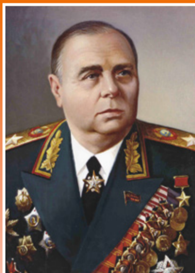
Маршал Советского Союза МЕРЕЦКОВ Кирилл Афанасьевич (1897–1968)