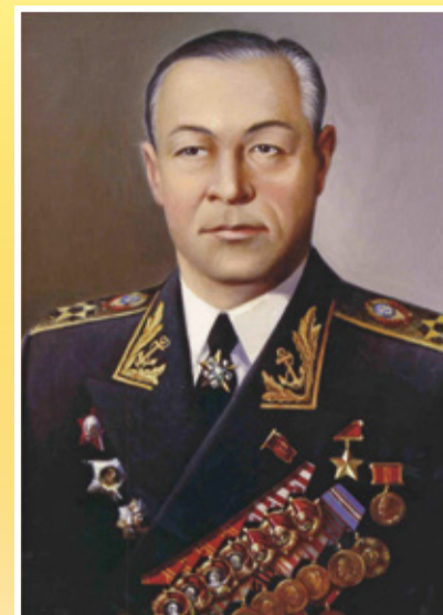
Адмирал Флота Советского Союза КУЗНЕЦОВ