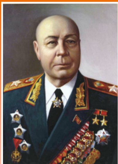
Маршал Советского Союза ТИМОШЕНКО