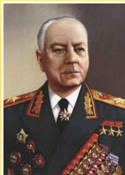
Маршал Советского Союза ВОРОШИЛОВ Климент Ефремович (1881–1969)

Дважды Герой Советского Союза Герой Социалистического труда