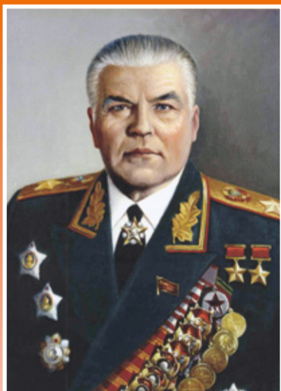
Маршал Советского Союза МАЛИНОВСКИЙ Родион Яковлевич (1898–1967)