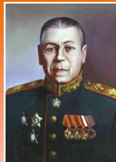
Маршал Советского Союза ШАПОШНИКОВ