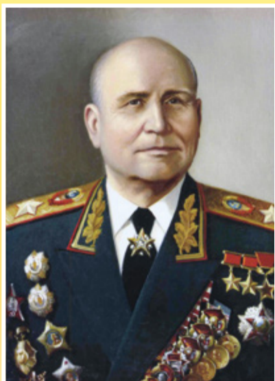
Маршал Советского Союза КОНЕВ