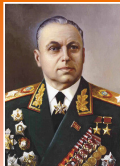
Маршал Советского Союза РОКОССОВСКИЙ Константин Константинович (1896–1968)