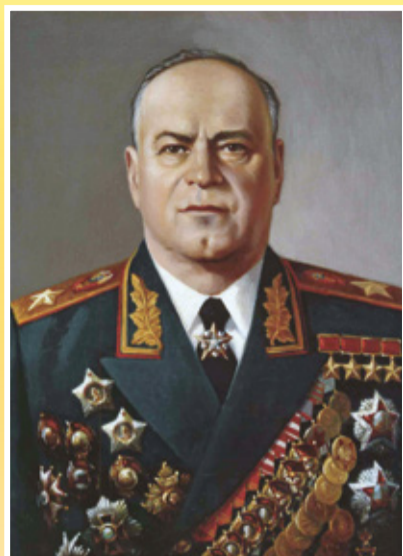
Маршал Советского Союза ЖУКОВ