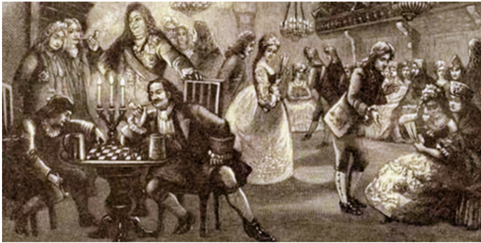
Ассамблея при Петре I, иллюстрация 1912 года

9 июня ежегодно мы отмечаем годовщину со дня рождения Петра I. Точное место рождения его неизвестно. Некоторые историки указывали местом рождения Теремной дворец московского Кремля, а согласно народным сказаниям Пётр родился в селе Коломенское, указывалось также и Измайлово.