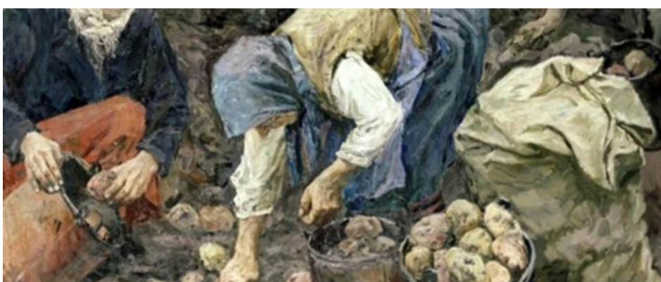
Сбор картофеля. Пластов А.А. 1957 г. (фрагмент)